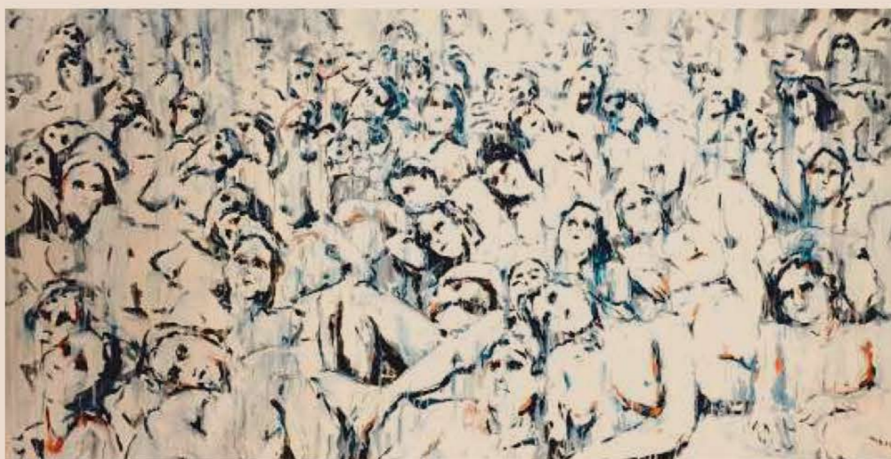
«Homo Cataracta», acrylique sur papier, 2017

Des êtres de densités variables se chevauchent dans ce corps à corps de la multitude: certains ne sont que des contours, de simples traits, des ébauches de mouvement, d'autres ont l'épaisseur incendiaire d'un